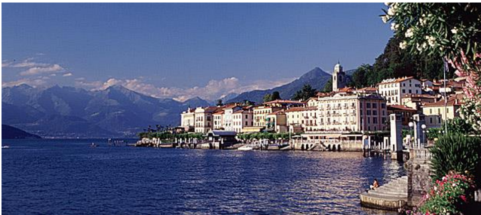
Bellagio: 10 min mit dem Auto von der Casa Orchidea